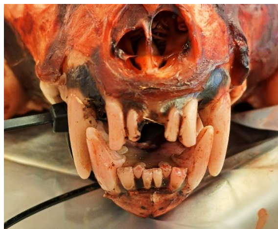
Figur 1. Tandstatus hos individ M531013.

Samtliga järvar skjutna inom licensjakten visade sig i allmänhet haft god hälsa. En hane (M531013) från Härjedalen saknade två framtänder i överkäken samt hade två förskjutna framtänder i underkäken (Figur 1.).