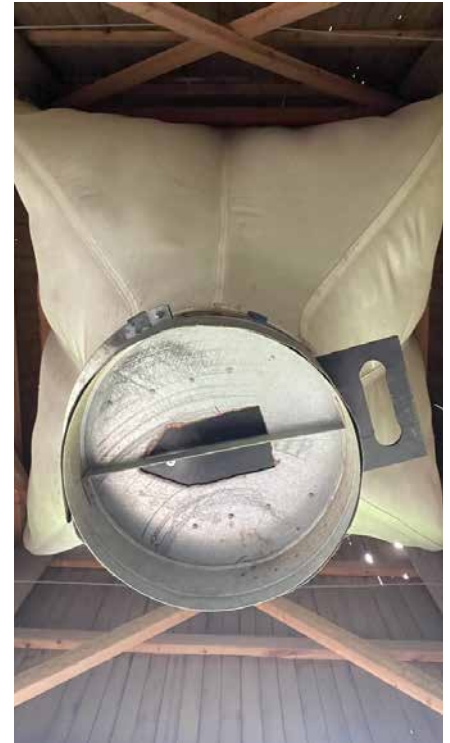
GOVVA 3. Ovdamearkkat got vurke fápmofuoddara bohccuide. Gudot bealis; toardnasilo, stuoraseahkka, gokčojuvvon silo silogokčasiin