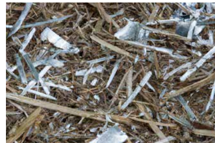
Alumiidnaburkket ensilášas - Várra!

Fysikálalaš várat seammás go iežá várat ilbmet juohke dásis fuođaráiddus. Ovdamearkan gáldus sáhttet leat billánan vuodđogálvvut, boastut hábmejuvvon dahje heittot doalahuvvon bargolanjat ja biergasat ja/dahje heivemeahttun bargorutiinnat.