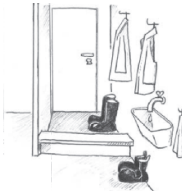
Figur 1. Vid hygiengränsen tvättar du händer och byter skor och kläder. Den rena sidan av hygiengränsen (bänken) får inte beträdas med skor eller skoskydd som varit i kontakt med golvet på den orena sidan.

När du eller dina besökare skall gå in till hönsen bör ni byta skor och sätta på skyddskläder. Helst bör du ha en hygiengräns som du måste passera innan du går in till hönsen. En hygiengräns skall vara en barriär, en skiva eller bänk, som sluter tätt mot golvet för att det inte skall blåsa in smuts under den. Det är en fördel om man kan sitta på den när man byter skor. Vid en hygiengräns byter man kläder och skodon. Hygiengränsen skall vara placerad så att den alltid måste passeras när man går in och ut ur hönshuset. Finns det möjlighet att tvätta händerna i anslutning till hygiengränsen är det bra. Annars kan man ha en flaska med handdesinfektion stående där. Syftet med detta är att förhindra den eventuella smittan man kan ha på kläder eller händer.