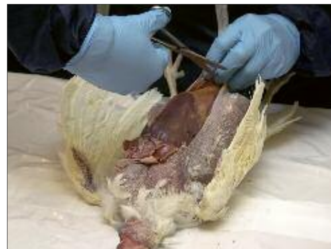
Obduktion av fjäderfän kan ge värdefull information.

Om dina höns signalerar tecken på sjukdom så ska du omgående kontakta din veterinär.