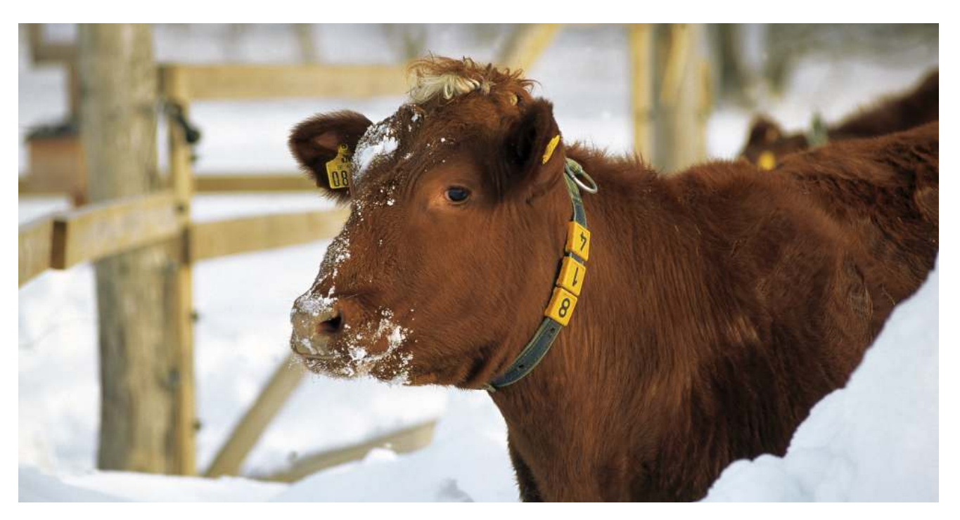
Figur 12: Att Sverige sedan 2014 är fritt från bovin virusdiarré har stor betydelse för nötkreaturens hälsa i landet.

Sedan 2018 har BVD-övervakningen en riskbaserad design där besättningarna kategoriseras individuellt baserat på antalet besättningar som de har köpt djur från och sålt djur