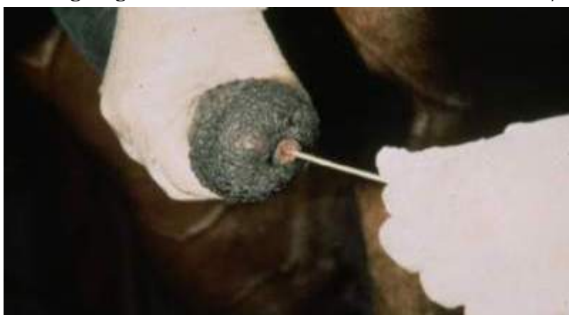
Provtagning i uretramynning.

Om analys av sperma önskas skicka då in minst 0,1 ml sperma i ett sterilt provrör till labbet