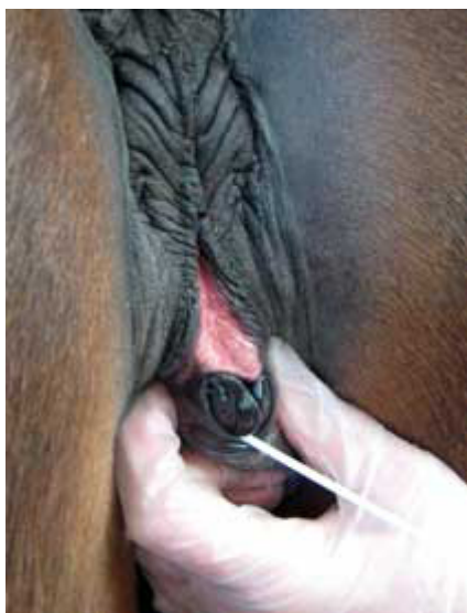
Provtagning från fossa clitoridis.

CEM-bakterien, Taylorella equigenitalis , kan ofta isoleras från sekretet som finns i den centrala sinus clitoridis.