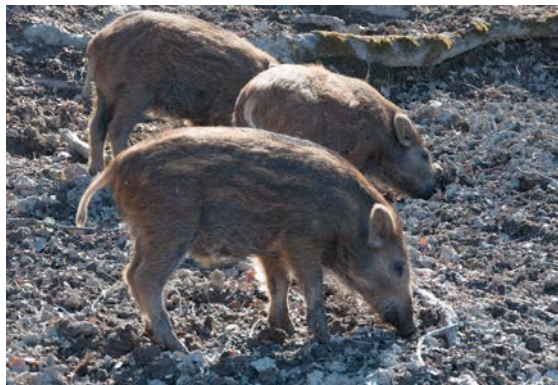
Vildsvin (hägnade).

Det låga antalet undersökta vildsvin utgör dock inte underlag för att kunna säga att vildsvin i allmänhet inte utgör en smittrisk till andra utegående grisar eller hur stor risk det är att vildsvin kan infekteras från salmonella-smittade tamsvin.