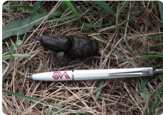
Rävspillningar samlas in för övervakningen av rävens dvärgbandmask.

Teknikutveckling för analys av djurart från djurspillning har också utförts på SVA, för att undersöka om spillningar som insamlats till dvärgbandmaskövervakningen som var från räv eller från andra arter. När andelen säkra rävspillningar är kända kan man göra bättre beräkningar på hur vanligt förekommande dvärgbandmask är i ett område.