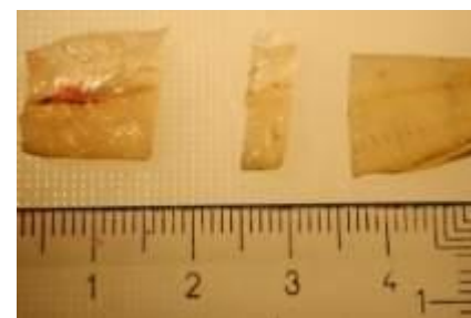
Organbit (max bredd 0,5 cm) för formalinfixering.

OBSERVERA! Iakttag de skyddsföreskrifter som gäller (levereras tillsammans med formalinet). Formalin är en giftig substans och bör hanteras därefter.