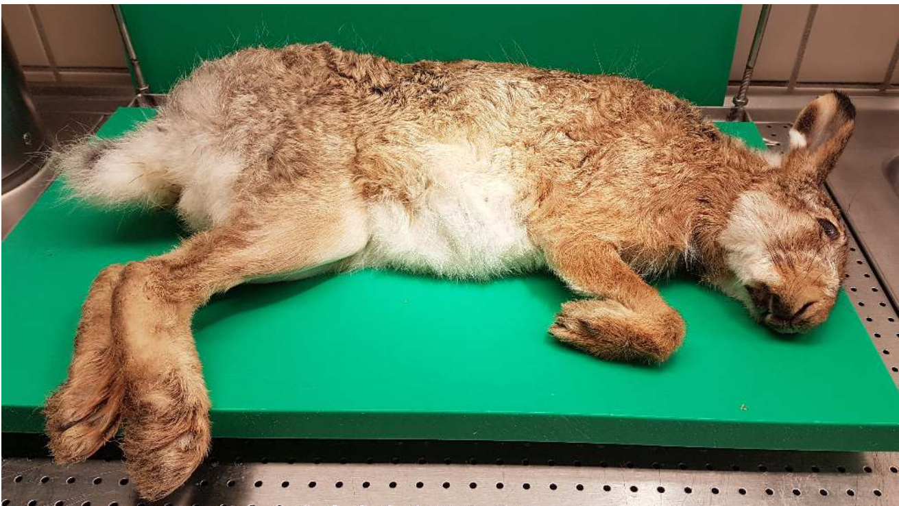
Figur 57: Skogshare insänd från Luleå för undersökning för tularemi.

Hos svenska harar, och hos många gnagare som dör av tularemi, ses vanligen sepsis med spridda inflammatoriska förändringar i flera organ. En del av hararna har sjukliga förändringar som tyder på ett något mer långvarigt sjukdomsförlopp, men till slut får infektionen ett mer akut förlopp som slutar med blodförgiftning. Köttätare och allätare är djurarter som inte utvecklar någon sjukdom eller endast lindriga kliniska symtom. Studier av flera arter av vilda rovdjur och allätare i Sverige och andra länder har påvisat antikroppar men inga tecken på sjukdom.