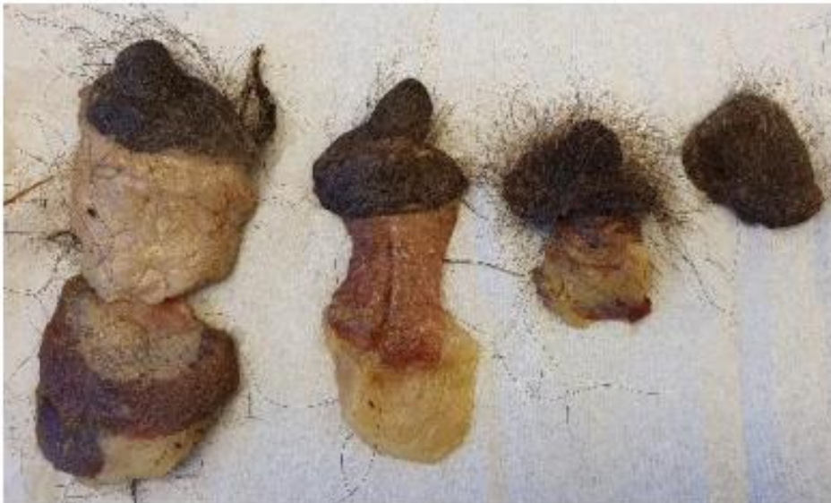
Bild: Fotot visar korrekt utskurna spenar i olika storlekar. Under den mörka huden ses vitgul till rosa juvervävnad, sedan vitare, ibland gult fett och underst lite muskel på vissa prover.

Spene tas endast på honor som har vätska i en eller flera spenar. Lokalisera den största spenen. Använd stansverktyg för att skära ut denna och eventuell underliggande juvervävnad. Gummikorken som skyddar den vassa ändan flyttas till den trubbiga änden, som grepp och skydd för handen. Med stansverktyget över spenen, skär med skruvande rörelser åt höger resp. vänster genom hud och underhudsvävnad (vitt fett och rosafärgad juvervävnad) ända ner till ren muskulatur (bukvägg- eller bröstorgsmuskulatur). Dra därefter spenen uppåt och använd kniv för att skära loss "botten" på den cylinder av vävnad som bildats. Skär så pass långt ner att alla vävnadslager (inklusive juvervävnad) ovanför muskulaturen följer med. Lägg i en liten ziplockpåse och märk upp med rätt etikett.