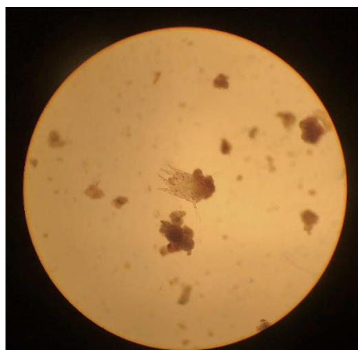
Ett öronskabbdjur ser man tydligt i mikroskop, när man undersöker öronvaxet från ett smittat lodjur.

Öronskabbdjurens livscykel är ungefär 21 dagar lång, och under den tiden går de igenom flera olika levnadsstadier - ägg, larv, två nymfstadier och slutligen vuxen. Vuxna