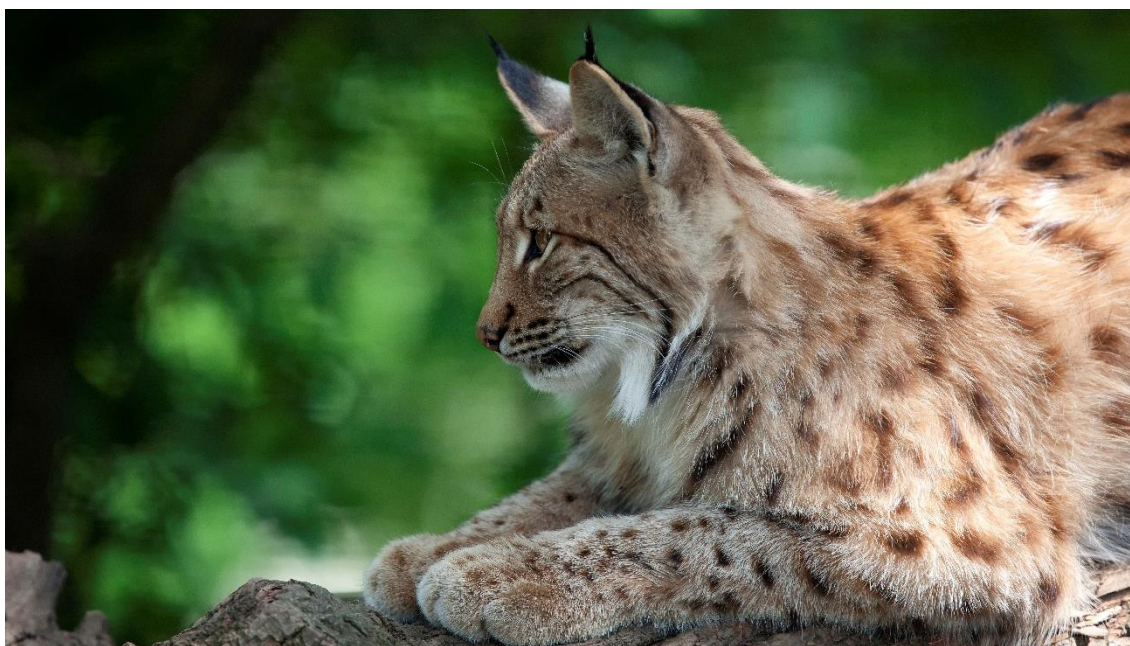
Vid licensjakten på lodjur undersöks vissa delar av besiktningsperson i fält – såsom yttre skador eller tecken på skabb – medan organbedömningar och tecken på sjukliga förändringar undersöks vid obduktionen.

Åtta lodjur hade anmärkningsvärt med tandsten. Av dessa kom tre från Gävleborg