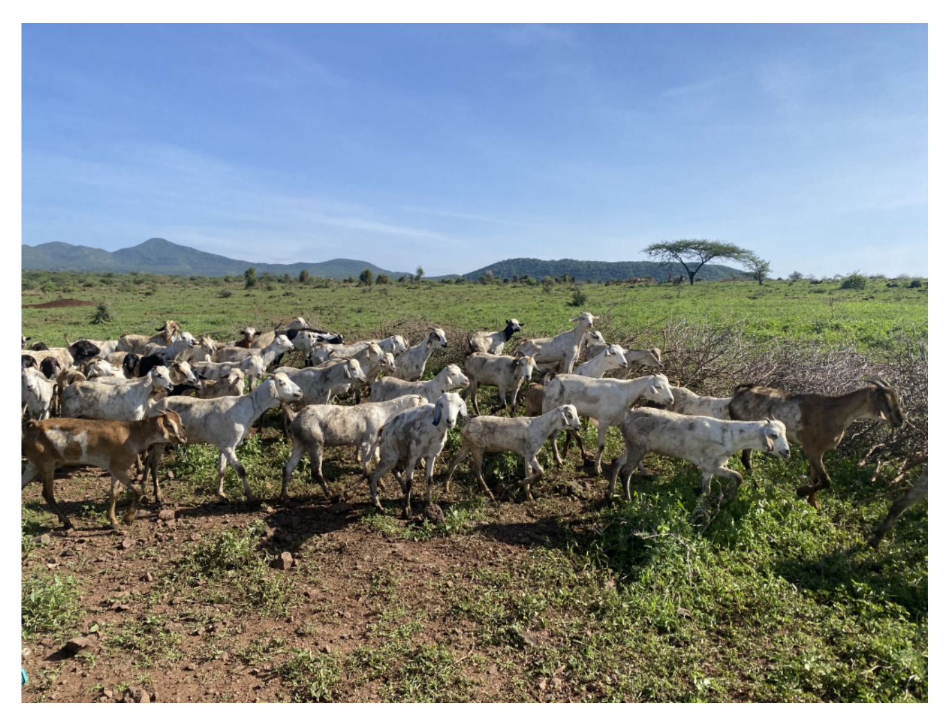
Figur 13: Opastöriserade mejeriprodukter från länder där brucellos är endemisk är den vanligaste smittkällan för brucellos i Sverige.