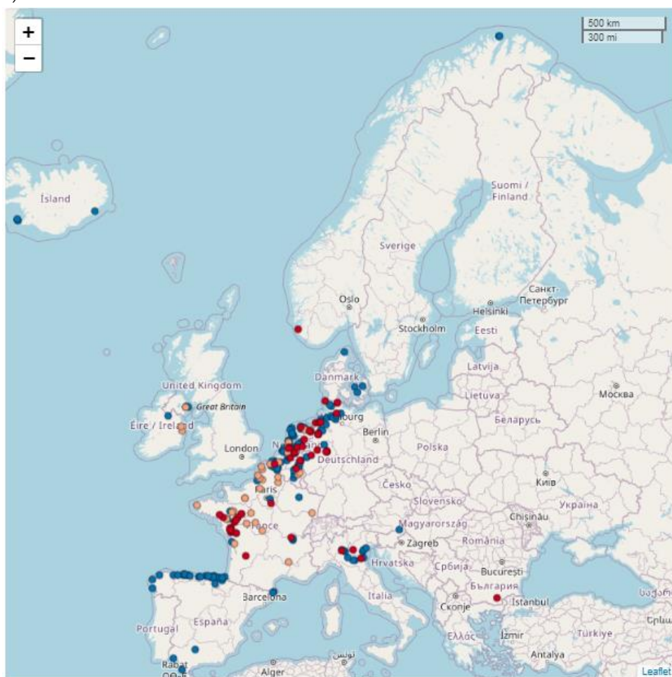
Figur 3. Karta över utbrott av högpato-gen fågelinfluensa på fjäderfä (röd prick) och andra fåglar i fångenskap (beige prick) och vilda fåglar (blå prick) rapporterade till ADIS med datum för konfirmering från 1 oktober 2022. Utdrag från ADIS 2022-10-27. De svenska fallen har inte hunnit komma in i ADIS ännu.