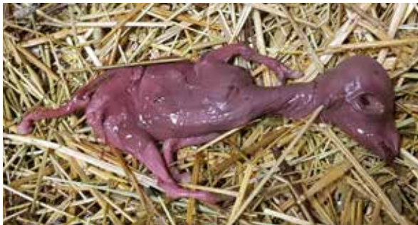
Kastat foster mitt i dräktigheten.

Skicka foster och placenta helst från flera aborterande getter för patologisk undersökning. Att få med placenta är viktigt eftersom den skada som orsakat aborten primärt kan ha drabbat placenta. Det finns ett mikrobiologiskt abortpaket för foster och fosterhinnor som det obducerande labbet kan använda sig av. Svabbprov kan tas från slidan. Bifoga gärna blodprov från aborterande getter. Det finns fall där det kan vara en fördel att bifoga även blodprov från lika gamla getter som gått i samma besättning men inte aborterat. Tankmjölk för antikroppsanalys kan också vara av värde för att utesluta vissa diagnoser.