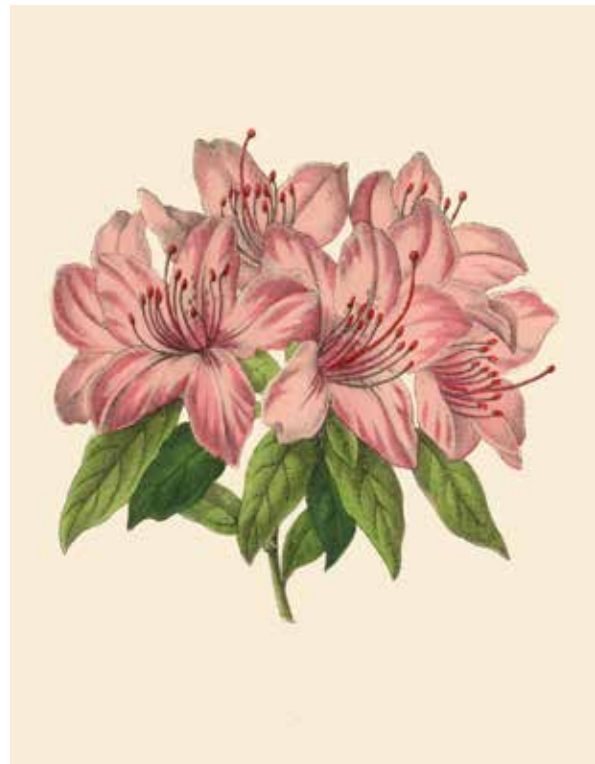
Rododendron är giftig för get och ger bland annat upphov till kräkningar.

Bland de förgiftningar getter kan drabbas av kan nämnas giftiga växter som idegran, fingerborgsblomma, rododendron, buskrosling, vattenstakra, azalea, nattskatta, murgröna, buxbom och korsört . Bland svamparna kan nämnas toppig giftspindling . Tänk på att växter som är vintergröna kan utgöra en stor lockelse för getter som vistas ute under vintern. Symtomen är vanligtvis salivering och kräkning, som kommer cirka 6 timmar efter förtäringen. Vanligaste orsaken till kräkningar är rododendron (ger kraftig kräkning), buskrosling och nattskatta. Men förgiftningen kan också vara dödlig beroende på vilken växt det rör sig om och hur mycket geten har ätit av den.