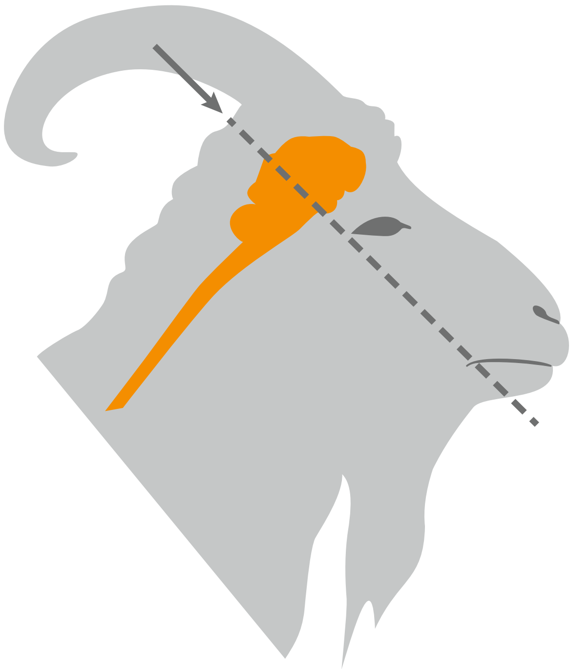
Placering av bult. Illustration: Oloph Demker/SVA, efter förlaga.