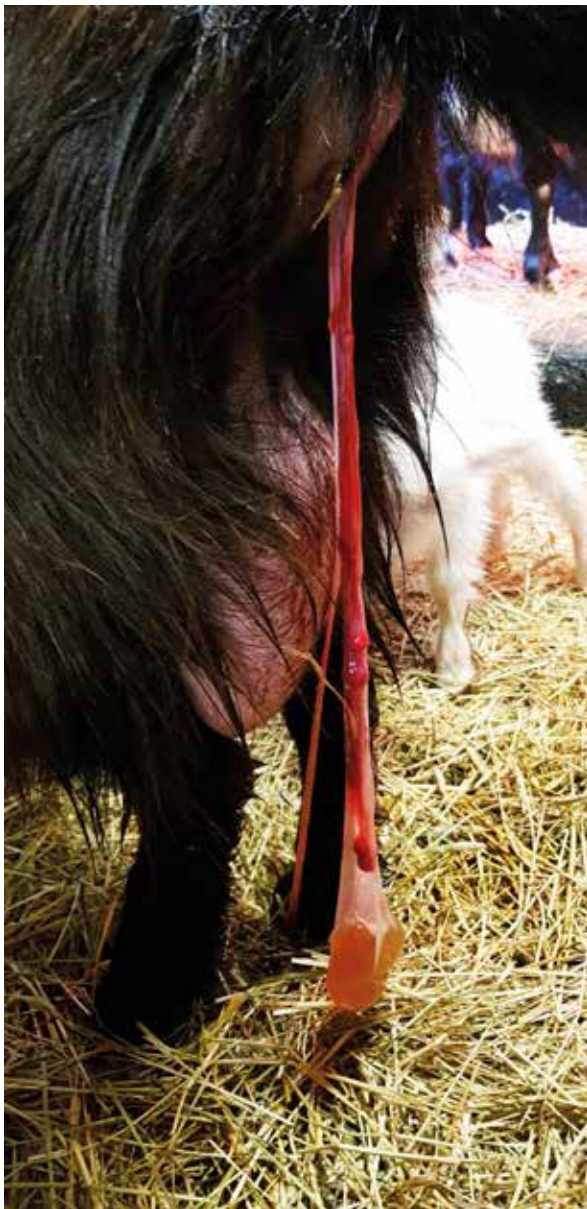
Kvarbliven efterbörd.