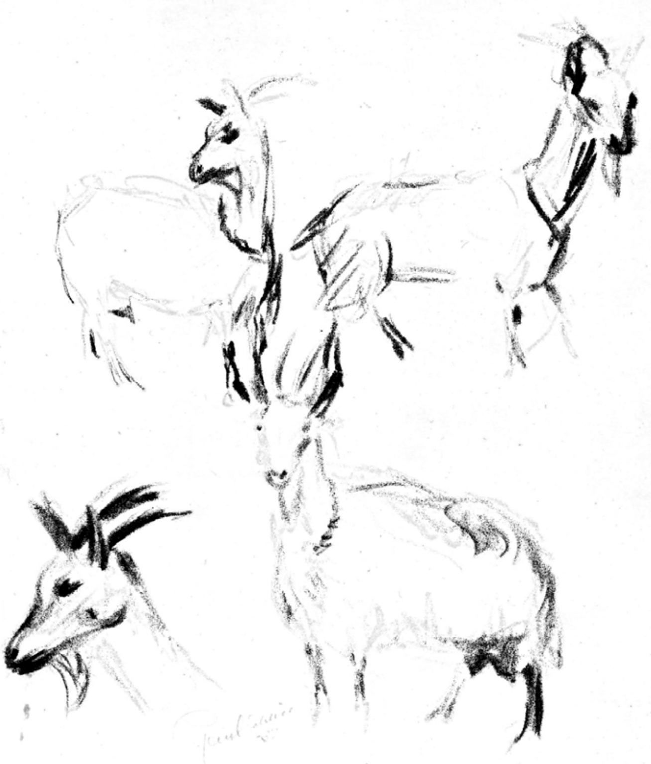
Illustration: Paul Sahlin, Ås.