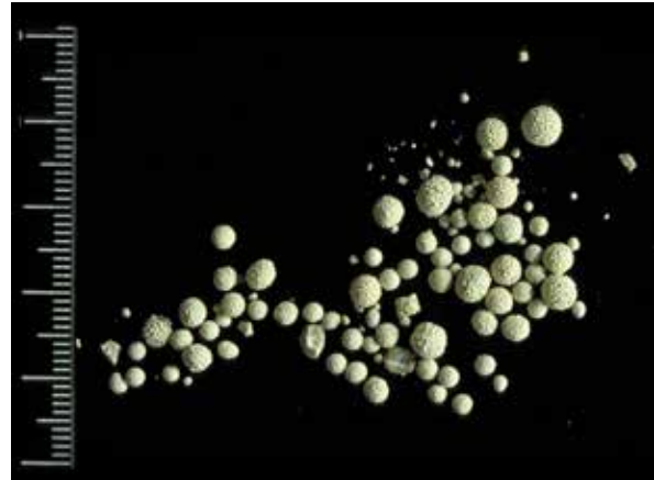
Urinvägskonkrement bestående av kalciumkarbonat (calcit).

Även brist på vitamin A påstås i en del litteratur gynna uppkomst av urinsten.