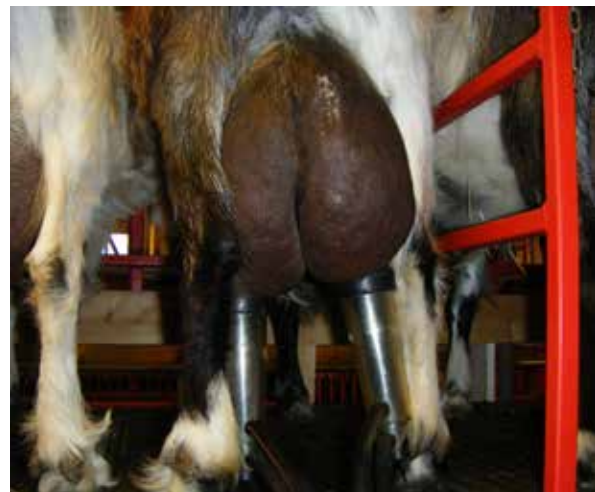
De flesta getter i Sverige maskinmjölkas (notera det fint klippta juvret).

Slå ut getter med lång mjolkningstid/trånga spenkanaler. Genetisk bakgrund är vanlig.