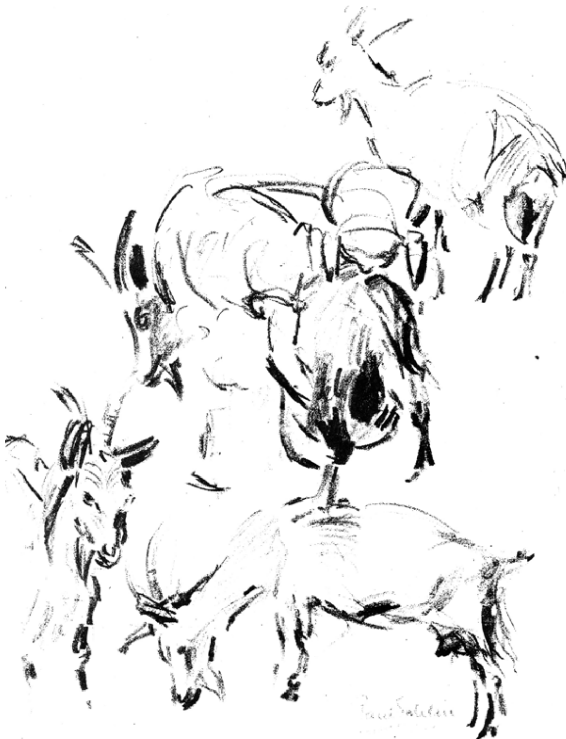
Illustration: Paul Sahlin, Ås.

Då gynekomasti kan vara ärftligt och nedärvas till söner bör bockar med gynekomasti tas ur avel. Läget i Sverige är obekant.