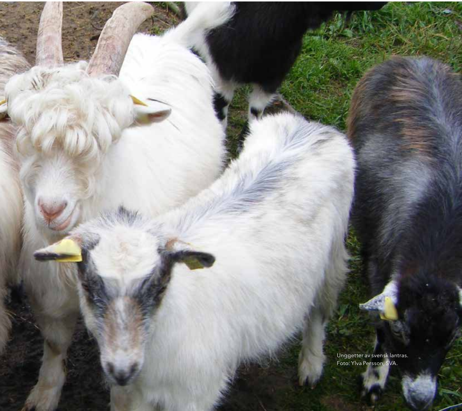
Unggetter av svensk lantras.

lagrar foder i kinden, sedera geten och kontrollera munhålan. Liten munrulle eller munkil behövs, samt gott lyse. Getter har normalt mycket ojämna tandytor och kan ha vassa tandkanter, men behov av raspning föreligger inte förrän tänderna orsakar skador i kind, tunga eller gom-tandkött. Någon lämplig rasp för får och getter säljs inte i Sverige (såvitt jag känner till). Tandrasp för ponnyhäst fungerar. Kontrollera även eventuell tandförlust som lett till att antagonisten har vuxit ut.