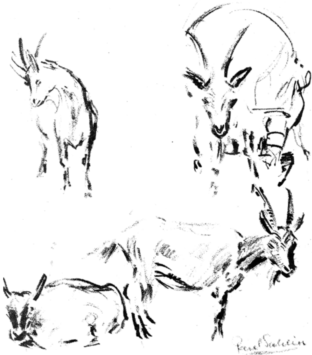
Illustration: Paul Sahlin, Ås.

Enligt SJVFS SJVFS 2021:10, saknummer K12, har veterinär eller laboratorium skyldighet att till Jordbruksverket anmäla vissa sjukdomar hos djur. För aktuell lista över sjukdomar samt hur de ska anmälas, se Jordbruksverkets webb.