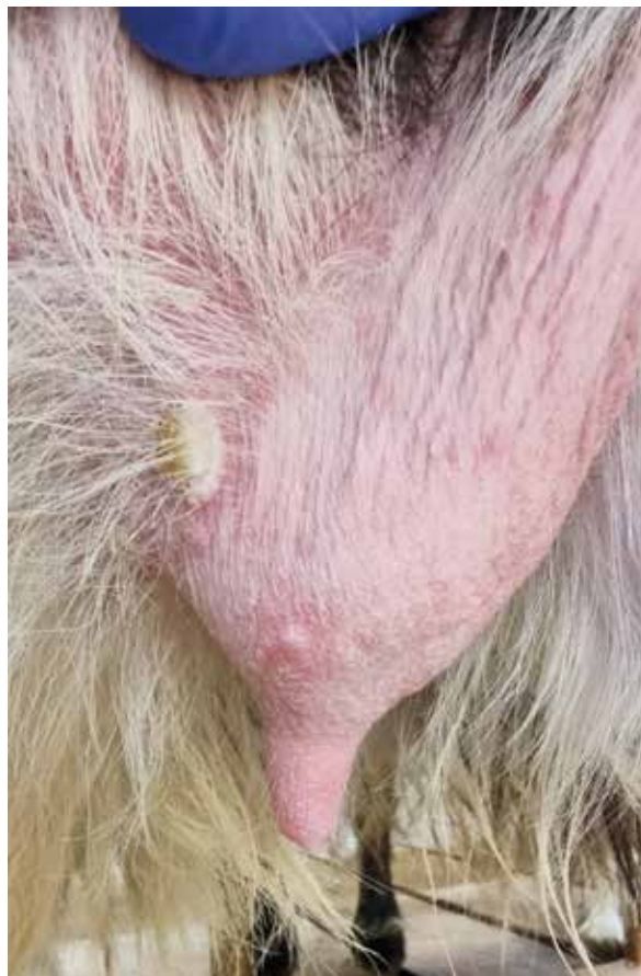
Stafylokokkinfektion på juvret: impetigo.

Behandling är god hygien i perinealområdet efter partus och en uttorkande och gärna bakteriedödande sårsalva, som dock inte får hamna i mjölken. Tvätt med 0,5-procentig klorhexidin- eller annan spendopps-lösning kan också användas. Generellt nedsatt motståndskraft till exempel på grund av underutfodring eller mineralbrist (t.ex. zink) predisponerar för sjukdomen, så kontrollera utfodringen.