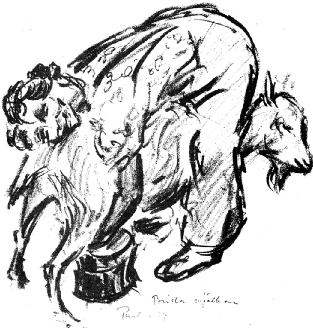
Illustration: Paul Sahlin, Ås.

Sex ben i backen, huvud i båda ändar och röven i nacken?