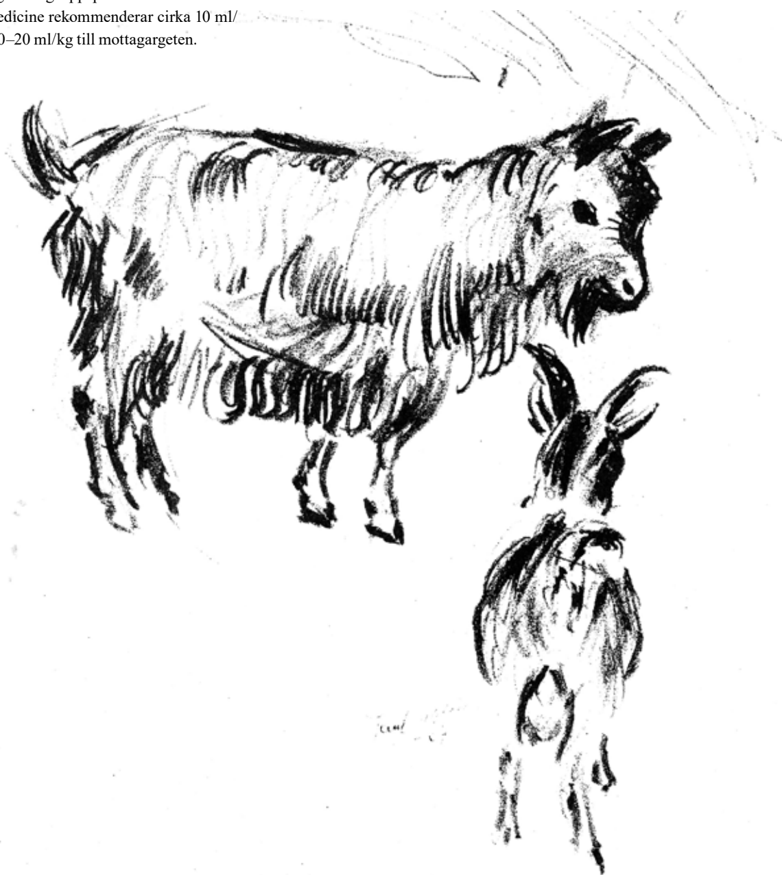
Illustration: Paul Sahlin, Ås.

Blod (med heparintillsats) kan tas från vilken get som helst. Blodkroppssönderfall pga blodgruppsproblem förekommer men är ovanligt. Goat medicine rekommenderar cirka 10 ml/kg från givargeten, och 10–20 ml/kg till mottagargeten.