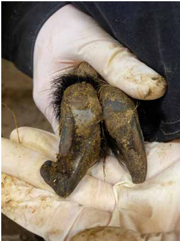
Förvuxna klövar är den vanligaste klöväkomman hos get.

Getternas klövar skiljer sig till utseende och form utseendemässigt från fårens. Från sidan är klövförmen romboid, där tåvägg och traktvägg är parallella och lika långa. Detsamma gäller för kronrand och sulkant. Väggarna är mer lodräta än hos får, vilket ökar möjligheten för ett klättrande djur som get att bära större delen av sin kroppstyngd med väggen till exempel på