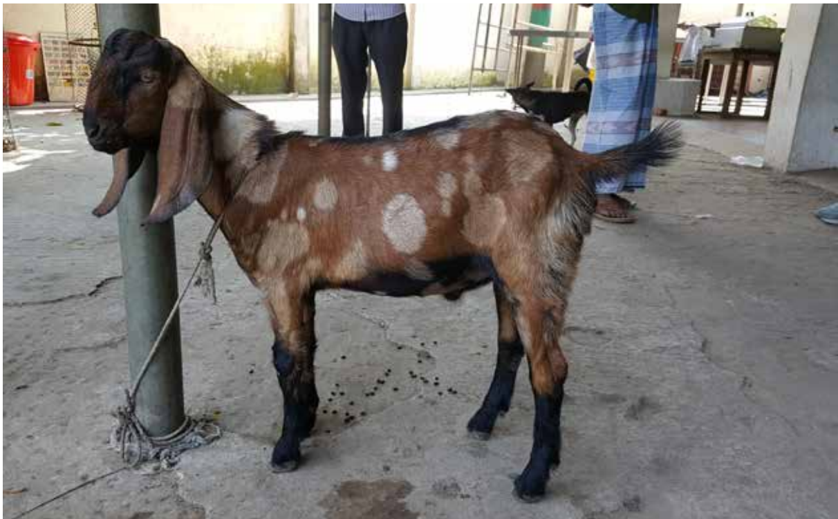
Get i Bangladesh.