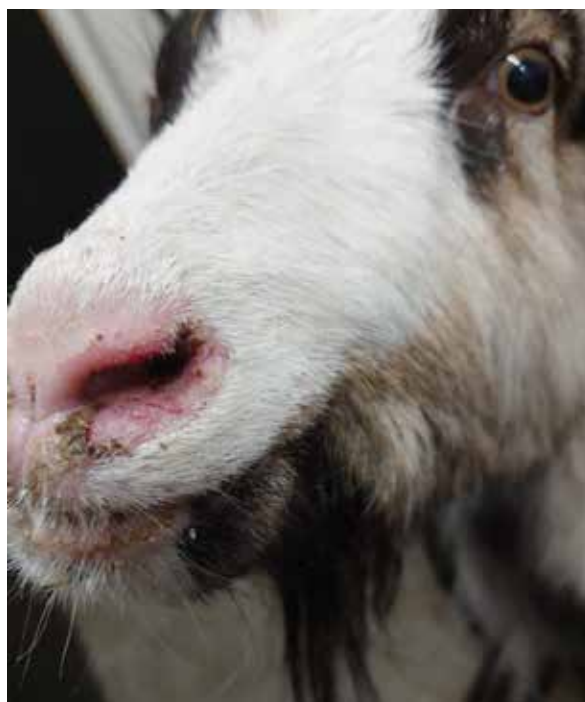
Stafylokokkinfektion hos get visar sig ofta som kruster kring nos.