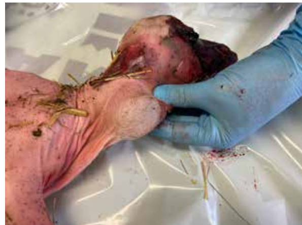
Dödfött lamm med kraftigt förstora sköldkörtel och mycket gles behåring: medfödd struma.

Det finns också rapporterat (ej undersökt i Sverige) att det finns blodslinjer hos get där struma är vanligare, alltså en genetisk bakgrund i form av en autosomal recessiv gen, ingen jodbrist. Speciellt boergetter och angoragetter har rapporterats med denna genetiska defekt. Mer eller mindre utbredd hårlöshet sägs förekomma på dessa killingar redan från födseln.