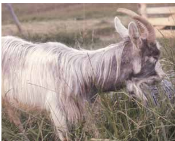
Böldsjuka i retrofaryngeallymfknuta.

Norge i deras projekt ”Friskere geiter” där man bland annat sanerade majoriteten av norska getbesättningar mot böldsjuka.