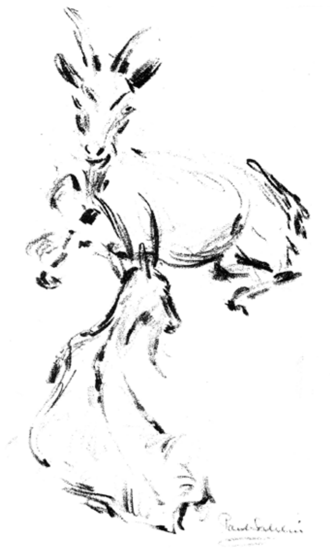
Illustration: Paul Sahlin, Ås.

Tumörer är inte ovanligt hos get. En amerikansk undersökning följde under 25 år upp diagnostiserade tumörer hos get. Vanligast var olika typer av lymfom följt av hudtumörer och tymom. Alla juvertumörer som ingick i undersökningen var adenokarcinom. Man diagnostiserade också hemangiosarkom och malignt melanom. Det ska tilläggas att man fann rasskillnader, och av de getraser vi har i Sverige som ingick i undersökningen var frekvensen tumörer vanligare på dvärggetter och ovanligare hos boergetter.