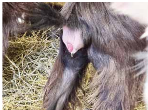
Slidframfall/vaginalprolaps på stående get.

Uterustorsion, livmoderomvridning, inträffar mindre sällan hos get än hos nötkreatur, dels på grund av att det ofta är foster i båda livmoderhornen, dels för att livmoderligamenten fäster annorlunda i bäcken hos get. Omvridningen uppkommer i slutet av förlossningens öppningsfas eller tidigt i utdrivningsfasen. Geten har krystningar men förlossningen avstannar. Vid vaginal undersökning kan en helt eller delvis obstruerad förlossningskanal palperas, med vridna veck i vagina. Fosterstatus kan bedömas med abdominell ultraljud. Livmodern kan "snurras upp" med samma teknik som används på ko. Vecken i vagina avslöjar om livmodern är roterad till höger eller vänster. Geten placeras liggande på samma sida som livmodern är roterad åt, och hon rullas över rygg för att "rulla ikapp" livmodern. Under rullningen fixeras livmodern via konstant tryck över buken, manuellt eller med hjälp av en plank. Rullningen kan upprepas vid behov. Tillåt lite tid (upp till 30 minuter) för blodgenomströmning av en eventuellt ischemisk cervix som ännu inte är fullt öppen innan födseln assisteras. Om rullning inte löser omvridningen kan kejsarsnitt vara ett alternativ.