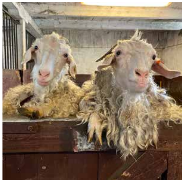
Angoragetter.

Angoragetten finns i flera varianter. I Sverige finns också den variant som kallas texgora efter avel i Texas, där man främst satsat på hårdighet. Först att ta in angoragetter i Sverige var Jonas Alströmmer (han med potatisen) på 1700-talet. Han tog även in merinofår och startade ullmanufakturindustrin i Alingsås.