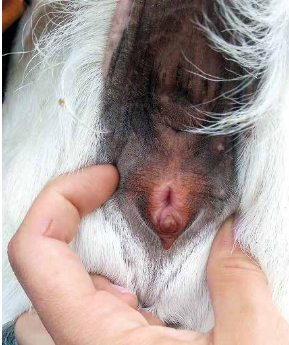
Intersex. Ursprung Kalle Hammarberg.

Lösningen är att undvika parning mellan två kulliga getter.