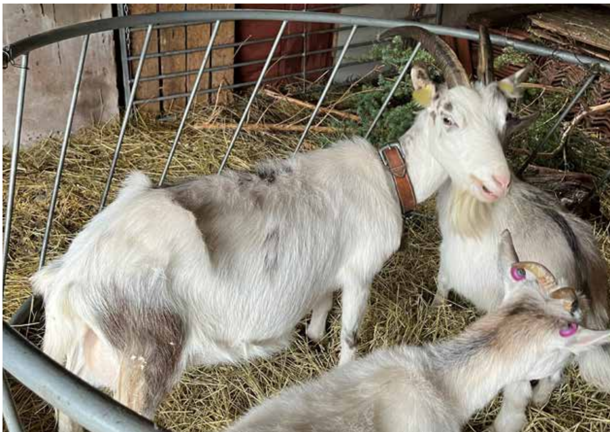
CAE kan ge avmagring hos vuxna getter.

Ingen medicinsk behandling finns, varför djur där sjukdomen diagnostiserats kliniskt bör avlivas. I saneringsprogram (se nedan) ska seropositiva getter skiljas från flocken. Vanligast sker det genom avlivning.